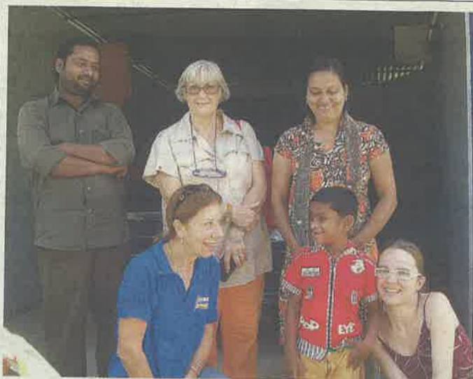
Volontari di Oremi Onlus in India

La prima iniziativa fu quella di costruire 12 casette in muratura per sostituire le capanne che l'acqua aveva spazzato via e distribuire 45 barche ad altrettanti pescatori che l'avevano perduta. Il secondo atto di «Progetto India» è stato quello di dotare il villaggio di una scuola, ora frequentata da 1500 bambini. Da qualche anno, una delle attività più importanti del sodalizio astigiano è quella delle adozioni a distanza. Sono